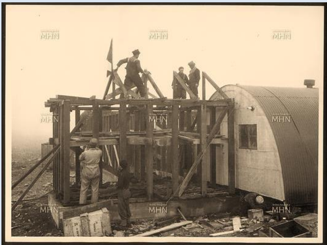
Construcción de las instalaciones que constituyeron la Base "Soberanía" que más tarde se denominara Base Arturo Prat

Islas y canales salpicados de témpanos, eran sorteados virginalmente, pues un solo error podría llegar a ser fatal.