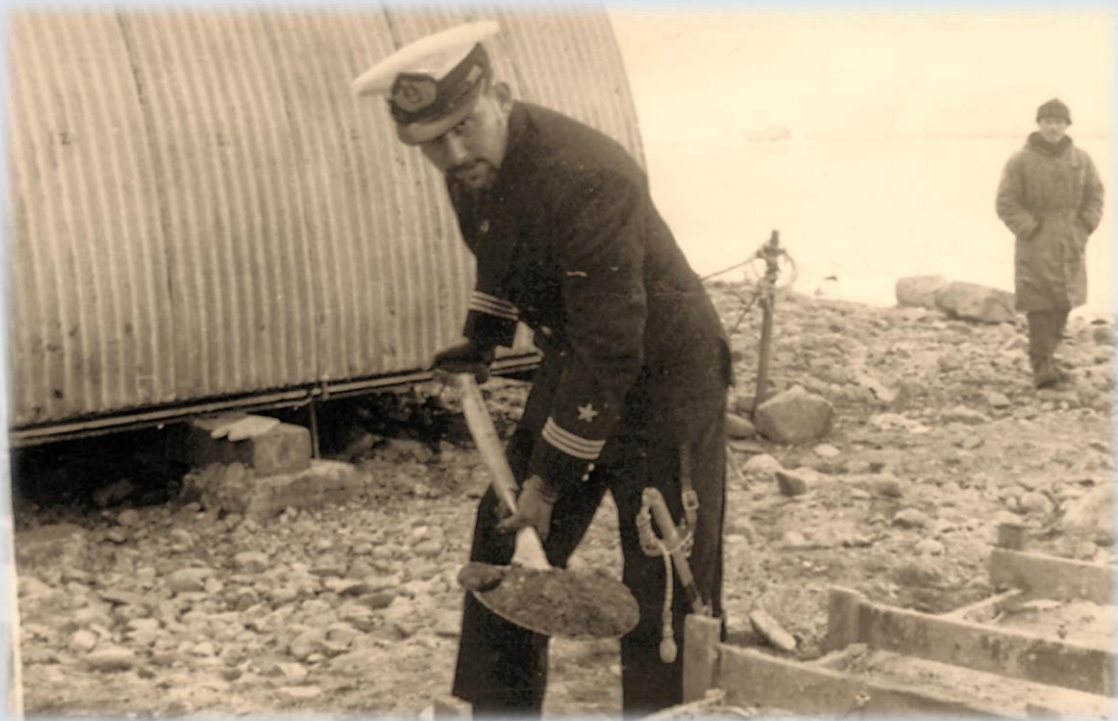
Uno de los oficiales navales ayuda a enterrar el pergamino de fundación