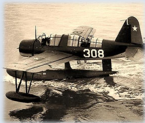
Hidroavión Vought Sikorsky N°308

Posteriormente se realizaron varios otros vuelos a las Shetland del Sur, los que al término de la comisión registraron un total de 20 horas, de ellas 16 efectuadas por el teniente Tenorio, quien fuera el primero en amarizar en isla Decepción, de gran importancia futura para el país y nuestra Fuerza Aérea.